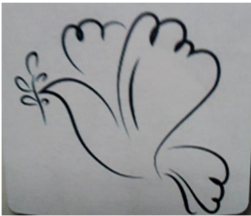
شكل (٦) تحوير خطي لوحدة زخرفية (لطانر)

٨- يوضح شكل (٦) الذي امامك نوع من أنواع التحوير: