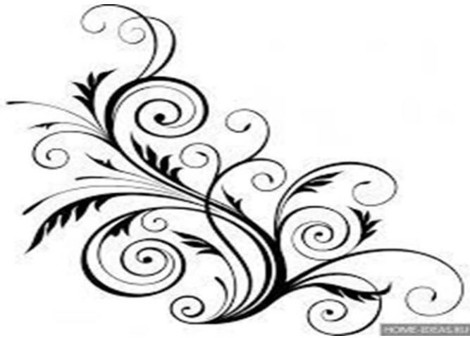
٢- التشابك .....