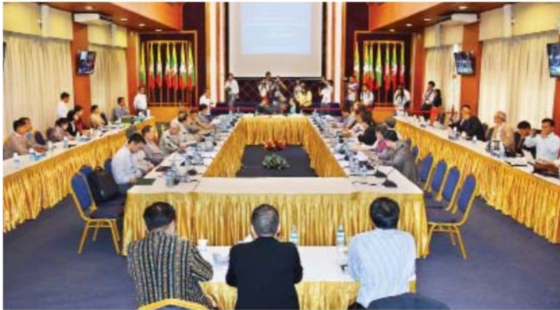
ငြိမ်းချမ်းရေးကော်မရှင် (PC)နှင့် UNFC ၏ နိုင်ငံရေးဆိုင်ရာညှိနှိုင်းဆွေးနွေးရေးကိုယ်စားလှယ်အဖွဲ့ (DPN)တို့ ဆဌမအကြိမ် တွေ့ဆုံဆွေးနွေးပွဲ ဂုဏ်ထူးဆောင်များ

ရန်ကုန်၊ ဩဂုတ် ၁၁ ငြိမ်းချမ်းရေးကော်မရှင် (PC)နှင့် UNFC ၏ နိုင်ငံရေးဆိုင်ရာညှိနှိုင်းဆွေးနွေးရေး ကိုယ်စားလှယ်အဖွဲ့ (DPN)တို့ တွေ့ဆုံဆွေးနွေးသည့် ဆဌမအကြိမ်အစည်းအဝေး ဖုတ်ယူနေ့ကို ရန်ကုန်မြို့၊ ရွှေလီလမ်းရှိ အမျိုးသားပြန်လည်သင့်မြတ်ရေးနှင့် ငြိမ်းချမ်းရေးဗဟိုဌာန(NRPC) ရန်ကုန်ရုံး၌ ယနေ့ နံနက် ၉ နာရီတွင် ဆက်လက်ကျင်းပသည်။ ဆဌမအကြိမ်အစည်းအဝေးတွင် UNFC ၏အဆိုပြုချက်များအနက်အချက်လေးချက်ကို နှစ်ဖက်ခေါင်းဆောင်များ သဘောတူ ဆွေးနွေးနိုင်ခဲ့ကြသည်။ ဆွေးနွေးမှုများ အပြီးတွင် ငြိမ်းချမ်းရေးကော်မရှင်ဥက္ကဋ္ဌ ဒေါက်တာတင်မျိုးဝင်းက ငြိမ်းချမ်းရေး ကော်မရှင်နှင့် နိုင်ငံရေးဆိုင်ရာညှိနှိုင်းဆွေးနွေး ရေးကိုယ်စားလှယ်အဖွဲ့ (DPN)တို့အကြား ယခု ခြောက်ကြိမ်မြောက် အစည်းအဝေး သည် ယခင်တွေ့ဆုံဆွေးနွေးမှုများထက် ငြိမ်း