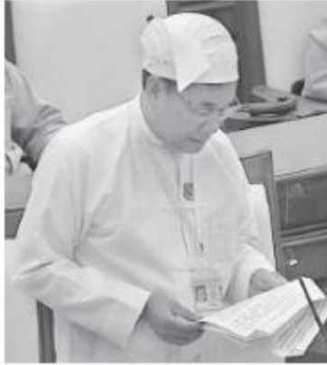
သယံဇာတနှင့် သဘာဝပတ်ဝန်းကျင် ထိန်းသိမ်းရေးဝန်ကြီးဌာန ပြည်ထောင်စုဝန်ကြီး ဦးအုန်းဝင်း

တို့ကိုထုတ်ပေးကြောင်း၊ ဗန်းမောက်-ကသာခရိုင်စဉ်ပြေးဆွဲလျက်ရှိသော ရေယာဉ်များဘေးအန္တရာယ်ကင်းရှင်းရေးအတွက် ရေယာဉ်များမထွက်ခွာမီ နေ့စဉ်စစ်ဆေးမှုကို ဆောင်ရွက်လျက်ရှိကြောင်း၊ ရေယာဉ်လိုင်စင်နှင့် လုပ်ငန်းလိုင်စင်သက်တမ်းတိုးရာတွင် အခွန်ပေးဆောင်ပြီးကြောင်း၊ အထောက်အထားမပြသနိုင်ပါက အဆိုပါရေယာဉ်ပြေးဆွဲခွင့်ကို ယာယီရပ်ဆိုင်းထားမည်ဖြစ်ကြောင်း ဖြေကြားသည်။ ထို့နောက် ဒဂုံမြို့သစ်(တောင်ပိုင်း)မဲဆန္ဒနယ်မှ ဦးအေးနိုင်၏ မြန်မာနိုင်ငံသစ်တောဝန်ထမ်းများ၏ လုံခြုံရေးအတွက် ယခင်က ကဲ့သို့ ဥပဒေ၊ စည်းမျဉ်းစည်းကမ်းများသတ်မှတ်ကာ လက်နက်များပြန်လည်တပ်ဆင်ပေးရန် အစီအစဉ် မရှိ မေးခွန်းနှင့်စပ်လျဉ်း၍ သယံဇာတနှင့်သဘာဝပတ်ဝန်းကျင်ထိန်းသိမ်းရေးဝန်ကြီးဌာန ပြည်ထောင်စုဝန်ကြီး ဦးအုန်းဝင်းက တရားမဝင်သစ်မှောင်ခိုသမားများ၏ အုပ်စုဖွဲ့ရန်ပြုတ်ခိုက်ခံရမှုများမှာ ၂၀၀၂-၂၀၀၃ ဘဏ္ဍာနှစ်မှ ၂၀၁၇-၂၀၁၈ ဘဏ္ဍာနှစ်အထိ လက်ထောက်ညွှန်ကြားရေးမှူးတစ်ဦးအပါအဝင် သစ်တောဝန်ထမ်းရှစ်ဦးသေဆုံးခဲ့ပြီး ၄၂ ဦးခန့်ရာရရှိမှုများဖြစ်ပေါ်ခဲ့ကြောင်း၊ ၂၀၀၈ ခုနှစ် နိုင်ငံတော်ဖွဲ့စည်းပုံအခြေခံဥပဒေ အခန်း(၇) ပုဒ်မ ၃၃၈ တွင် “နိုင်ငံ