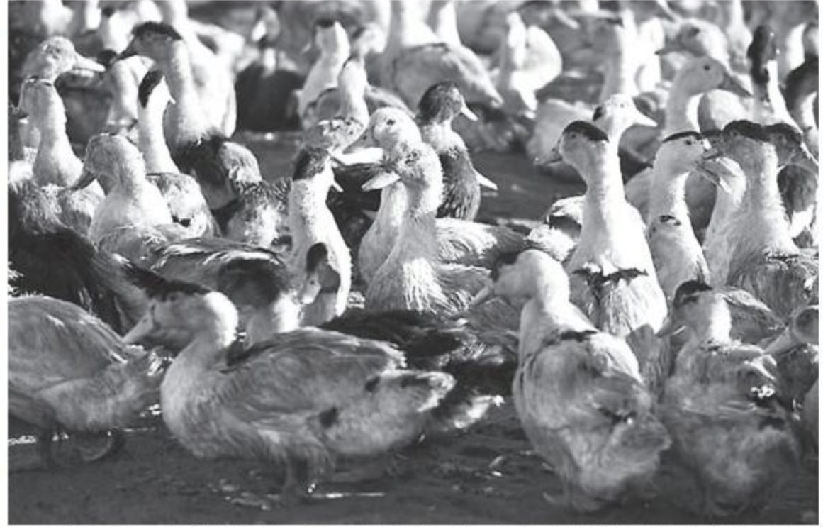
An immediate cull was ordered for all chicken, ducks and quail within a kilometre (0.6 miles) of the poultry infected with bird flu in San Luis town, north of Manila.

The six infected Philippine farms only sold their products to local consumers and none had been