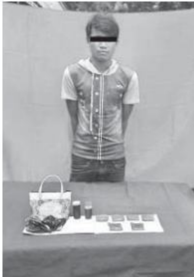
ဖမ်းဆီးရမိသူများကို မူးယစ်ဆေးဝါးများနှင့်အတူ တွေ့ရစဉ်။