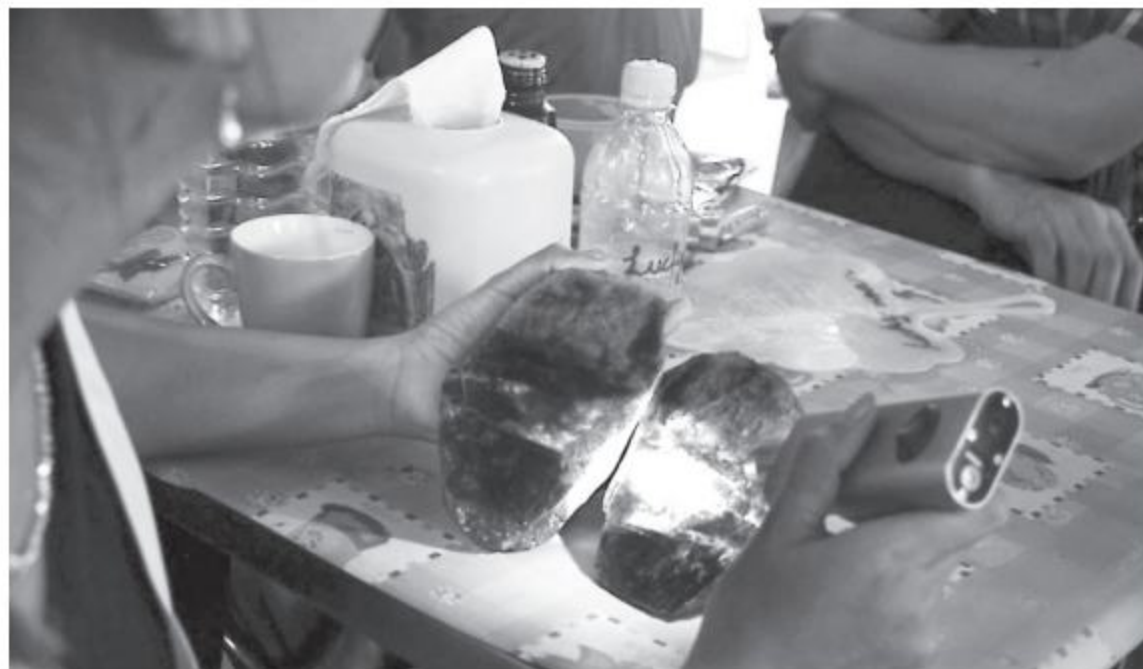
Locals examine the quality of a jade stone in the Hpakant Jade Mining Area of Kachin State.