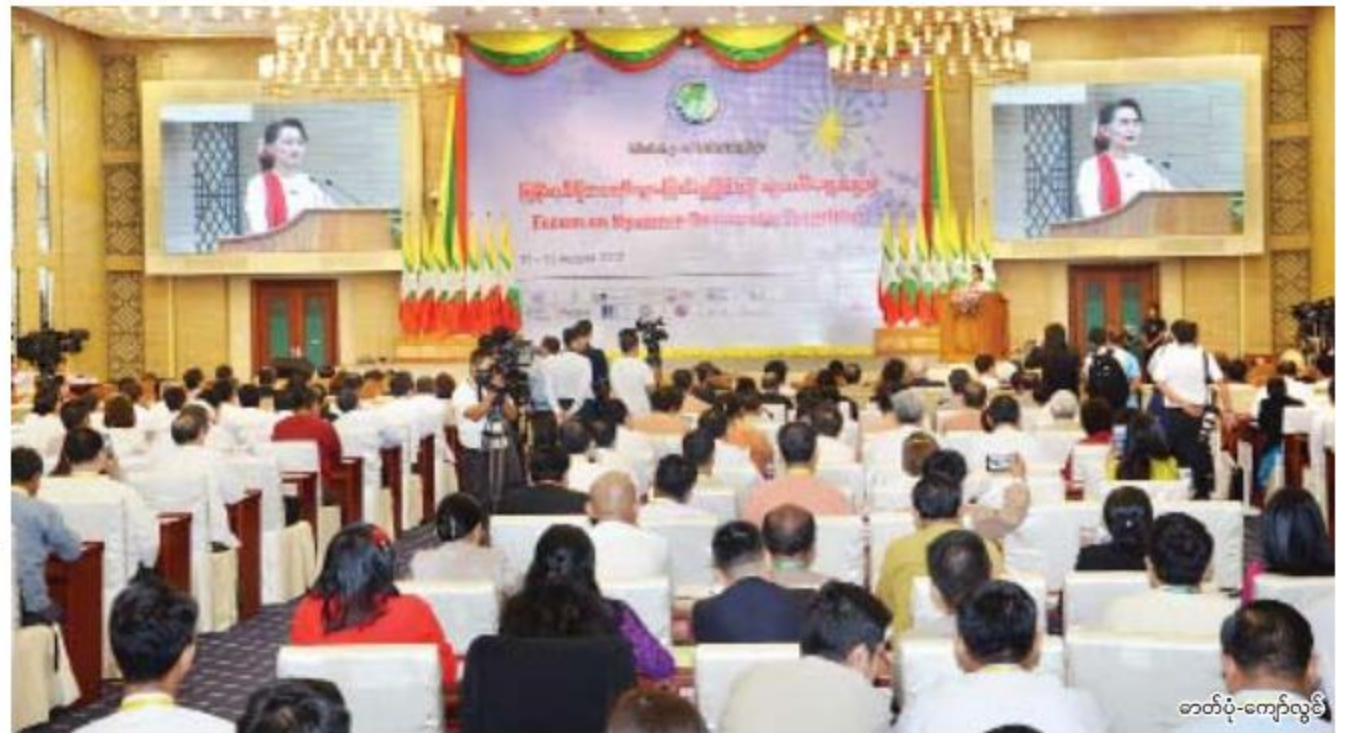
နိုင်ငံတော်၏အတိုင်ပင်ခံပုဂ္ဂိုလ် ဒေါ်အောင်ဆန်းစုကြည် မြန်မာ့ဒီမိုကရေစီကူးပြောင်းမှုဖြစ်စဉ် သုံးသပ်ဆွေးနွေးပွဲ ဖွင့်ပွဲအခမ်းအနားတွင်မိန့်ခွန်းပြောကြားစဉ်။

ရန်ကုန်-ပြည်ကားလမ်း လေးလမ်းသွားအဖြစ် အဆင့်မြှင့်တင်ခြင်းကို ဩဂုတ်လကုန်ပိုင်းတွင်ဆောင်ရွက်မည်