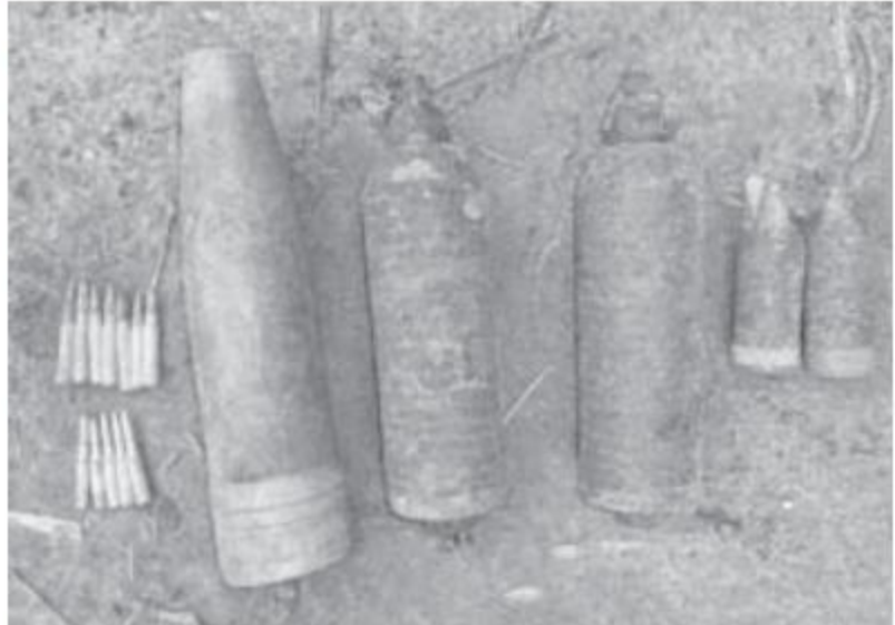
တူးဖော်တွေ့ရှိသည့် ဗုံးသီးဟောင်းများနှင့်ခဲယမ်းများကိုတွေ့ရစဉ်။

အဆိုပါတူးဖော်တွေ့ရှိခဲ့သည့် ဗုံးသီးများနှင့်ခဲယမ်းများအား နယ်မြေခံစစ်မြေပြင်အင်ဂျင်နီယာတပ်၌ စနစ်တကျထိန်းသိမ်းထားရှိပြီး လုပ်ထုံးလုပ်နည်းနှင့်အညီ ဖျက်ဆီးသွားမည်ဖြစ်ကြောင်း သတင်းရရှိသည်။ (၁၀၀)