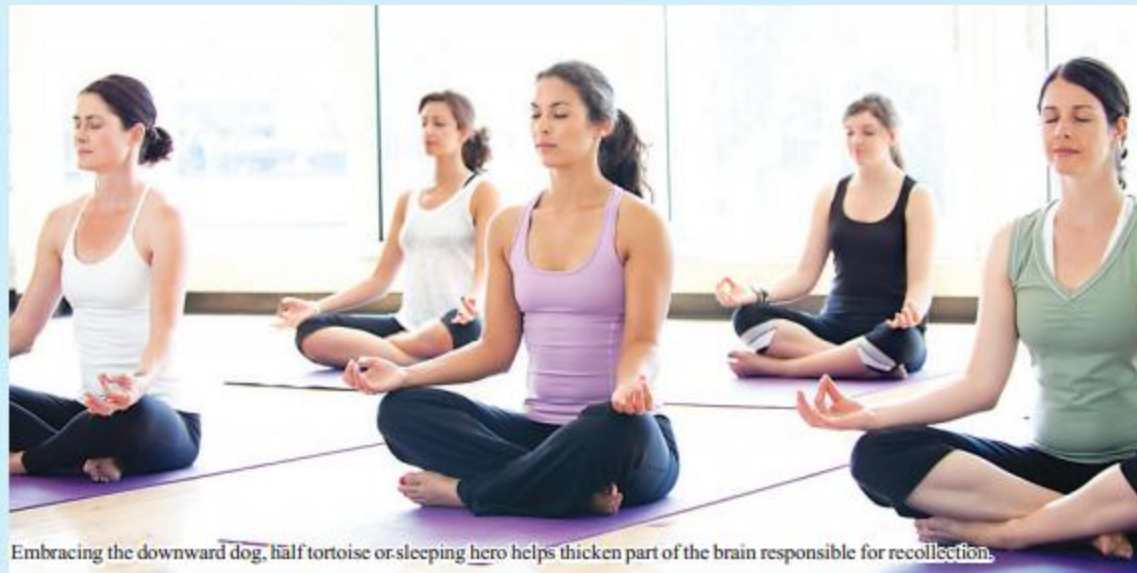
Embracing the downward dog, half tortoise or sleeping hero helps thicken part of the brain responsible for recollection.