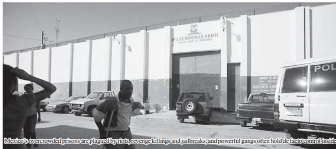
Mexico's overcrowded prisons are plagued by riots, revenge killings and jailbreaks, and powerful gangs often hold de facto control inside.