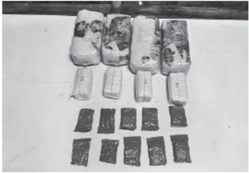
သိမ်းဆည်းရမိမူးယစ်ဆေးဝါးများကို တွေ့ရစဉ်။

များမှာ ထွက်ပြေးသွားခဲ့သည်။ အဆိုပါလှေအား စစ်ဆေးရှာဖွေရာ ပလတ်စတစ်ဖြင့်ထုပ်ထားသည့် WY စာတန်းပါ စိတ်ကြွေးသွပ်ဆေးပြား ၄၇၅၀၀ ပြား (ခန့်မှန်းတန်ဖိုးငွေကျပ်သိန်း ၉၅၀ ခန့်)အား သိမ်းဆည်းရမိခဲ့သည်။ သိမ်းဆည်းရမိ မူးယစ်ဆေးဝါးများအား မောင်တောမြို့ မူးယစ်တပ်ဖွဲ့စုသို့ စနစ်တကျ လွှဲပြောင်းအပ်နှံခဲ့ကြောင်း သတင်းရရှိသည်။ (၁၀၀)