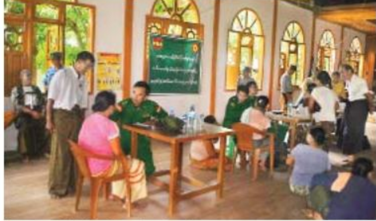
အရှေ့အလယ်ပိုင်းတိုင်းစစ်ဌာနချုပ် နယ်လှည့်ဆေးကုသရေးအဖွဲ့က ဒေသခံပြည်သူများအား ကျန်းမာရေးစောင့်ရှောက်မှုလုပ်ငန်းများ ဆောင်ရွက်ပေးစဉ်။

ထိုသို့ဆောင်ရွက်ပေးရာတွင် သွေးတိုးရောဂါ၊ ဆီးချို/သွေးချိုရောဂါ၊ အစာအိမ်နှင့်အူလမ်းကြောင်းရောဂါ၊ အနိုးရောဂါ၊ အရေပြားရောဂါ၊ အထွေထွေရောဂါဝေဒနာရှင်ဒေသခံပြည်သူ ၁၂၅ ဦးအား လိုအပ်သည့်ဆေးဝါးကုသမှုများနှင့် ရောဂါရှာဖွေစစ်ဆေးသင်