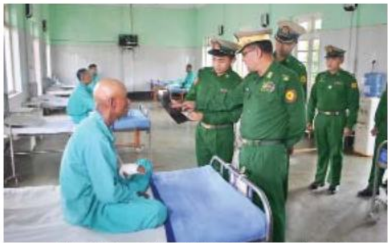
အရှေ့အလယ်ပိုင်းတိုင်းစစ်ဌာနချုပ် တိုင်းမှူး ဗိုလ်ချုပ်သန်းလွင် ဆေးရုံတက်ရောက်ကုသမှုခံယူနေသူတစ်ဦး၏ ကျန်းမာရေးစောင့်ရှောက်မှုများကို မေးမြန်းအားပေးစကားပြောကြားစဉ်။

အကောင်အထည်ဖော်ဆောင်ရွက်နေကြောင်း၊ ဥပဒေအရာရှိများသည် အရည်အချင်းသာမက ကျင့်ဝတ်သိက္ခာတွင်လည်း တိုးတက်ကောင်းမွန်ရန်လိုအပ်ကြောင်း၊ ယခုအခါ ဥပဒေအရာရှိကျင့်ဝတ်ကိုပြုစုထားရှိပြီးဖြစ်၍ ယင်းနှင့်အညီ လိုက်နာကျင့်ကြံနေထိုင်ရမည်ဖြစ်ကြောင်း၊ အရည်အချင်းပြည့်ဝပြီး ကျင့်ဝတ်စည်းကမ်းများနှင့်အညီ အဂတိတရားရှင်စွာအများအကျိုးကို သယ်ပိုးရွက်ဆောင်နိုင်ကြစေရန် ဥပဒေချုပ်များနှင့် ဥပဒေရေးရာဆိုင်ရာတာဝန်ရှိသူများက ကြပ်မတ်ဆောင်ရွက်ကြရန်လိုကြောင်း ဆွေးနွေးမှာကြားသည်။ အဆိုပါ လုပ်ငန်းညှိနှိုင်းအစည်းအဝေးကို နှစ်ရက်ကြာကျင်းပသွားမည်ဖြစ်ပြီး ဥပဒေစိစစ်ရေး ဥပဒေအကြံပြုကော်ပေးရေး၊ တရားစွဲနှင့်အမှုလိုက်လုပ်ငန်း၊ စီမံရေးရာနှင့် ဘဏ္ဍာရေးကိစ္စများကို ဆွေးနွေးကြမည်ဖြစ်ကြောင်း သိရသည်။ (သတင်းစဉ်)