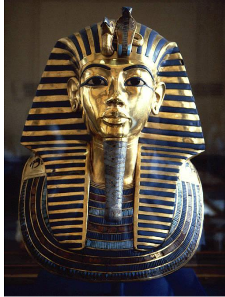
شكل رقم ( ٢ )

قناع الملك توت عنخ آمون - الأسرة الثامنة عشرة و تمثال نفس قناع الملك للفنان فلاديمير تسيفن