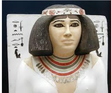
شكل رقم (٤)

رأس تمثال الأميرة نفرت و تمثال نفس العمل للفنان فلاديمير سيفين