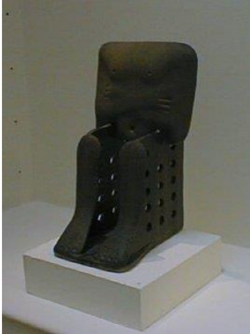
Empty Pharaoh, 1994