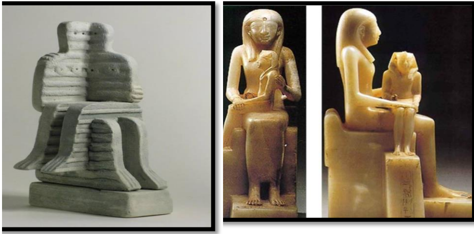
شكل رقم (٨)

أيضاً في تناول جديد و مختلف ( على اليسار ) لفلاديمير تي سيفن في عمل تمثال الملك ببي الثاني في تشكيل هندسي تجريدي و في بناء معماري راسخ و بأسلوب تشكيلي جديد مستمد من تقنية الشرائح النحتية و التي جاءت هذه المرة أكبر حجماً عن سابقتها ، البناء التشكيلي يمثل الملكة الأم في تجريد هندسي مفعم و واضح مع أبنها الملك الذي جاء بنفس حجمها و مخالفا للأصل المصري القديم في وضع منظوري مركب بحيث يمكن للعين أن ترقب المشهد كاملاً فقط من زاوية واحدة ، العمل بأكمله تعلوه خطوط عميقة في عودة لنيمة فلاديمير الخطية و هذه المرة أكثر عمقاً مع ظلال أقوى و ألوان أفتح عن المعتاد.شكل رقم(٨).