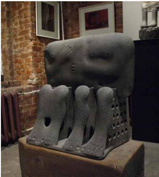
The Family Pair, 1994

طريق حزوز ناتئة في كتلة العمل تنتج عنها ظلال توحى بتشكيل الكف ، و في الجزء السفلي تشكل عدد من الشرائح النحتية المصاغة بأسلوب تجريدي عضوي الأطراف السفلية للقرم سنب و زوجته و قد تغاضى الفنان فلاديمير عن تشكيل أبنائهما كما في الأصل المصري القديم ، و مع البعد التام عن التفاصيل و عن استخدام الحزوز الخطية التي تميز أعمال الفنان فلاديمير تي سيغن تبدو عدد من الفتحات الموزعة على أماكن محددة في التشكيل النحتي ، و أخيراً تأكيده على عراقية و عمق التاريخ في استخدام اللون القاتم في العمل. شكل رقم (٥)