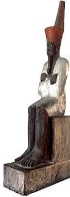
تمثال الملك منتوحتب الثاني - الأسرة الحادية عشرة - مؤسس الدولة الوسطى ٢٠٤٦ : ١٩٩٥ ق.م