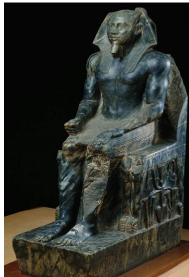
شكل رقم ( ١ )

تمثال الملك " خفرع" من الأسرة الرابعة و تمثال نفس الملك للفنان فلاديمير تسيفن