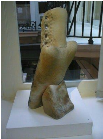
– Standing Bird, (2 pieces) –

سيفن الكتلة بدلاً من الشرائح الخزفية و هي أيضاً في بناء عضوي تجريدي يخل من تفاصيل التي لا تخل بروحه المستمدة من عبق مصر القديمة ، البناء يتكون من ثلاث كتل رئيسية تمثل على التوالي رأس التمثال و جسده و القدمين بدون تفاصيل تشريحية أو استخدام حروز خطية و التي تميز كما سبق أعمال فلاديمير و تظهر مرة أخرى عدد من الفتحات الموزعة على أماكن محددة في التشكيل النحتي ربما لحاجة تقنية ، مع التغيير في التناول اللوني فيما يحاكي الباتينة في النحت و التي تحاكي إلى حد ما لون العمل الأصلي و تقترب من الدرجة اللونية للحجر المستخدم. شكل رقم (٧)