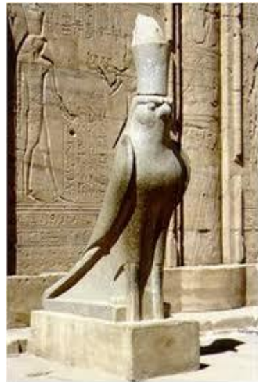
تمثال المعبود حورس