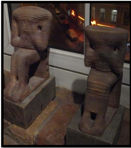
Large Pharaoh Family (2 pieces 4 parts), 1992