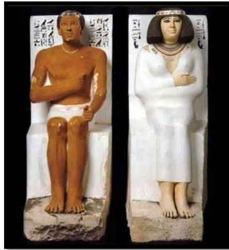
تمثالاً رع حتب و زوجته نفرت- الأسرة الرابعة - الدولة القديمة ٢٥٥٩ : ٢٥٣٥ ق