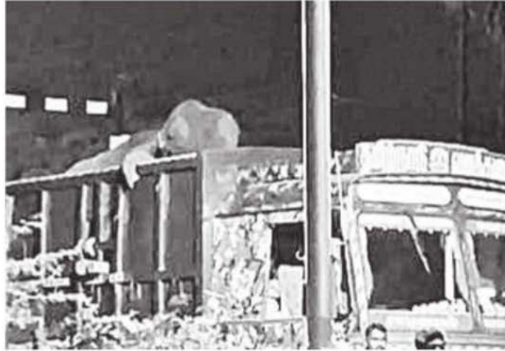
மணிமுத்தாறு வனச் சோதனைச் சாவடியிலிருந்து கோதையாறு கொண்டு செல்லப்பட்ட புல்லட் ராஜா யானை.