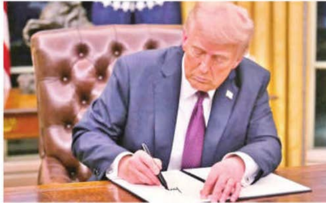
அரசாணைகளில் கையொப்பமிடும் டொனால்ட் டிரம்ப்.

பார்ஸ் பருவநிலை ஒப்பந்தத் திலிருந்து வெளியேறுவது, உலக சுகாதார அமைப்பிலிருந்து வில