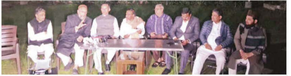
தில்லியில் செய்தியாளர்களிடம் பேசிய இடைநீக்கம் செய்யப்பட்ட எதிர்க்கட்சி எம்.பி.க்கள்

வக்ஃப் மசோதா கூட்டத்தில் அமளியால் நடவடிக்கை